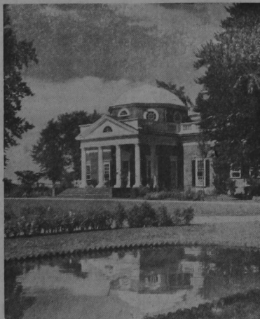
MONTICELLO, CERCA DE CHARLOTTESVILLE, EE UU

La fotografía reproduce un aspecto de Monticello, el hogar levantado por Thomas Jefferson, tercer Presidente de los Estados Unidos de América, en una colina cerca de Charlottesville, en el Estado de Virginia. Esta mansión es visitada anualmente por millares de personas.